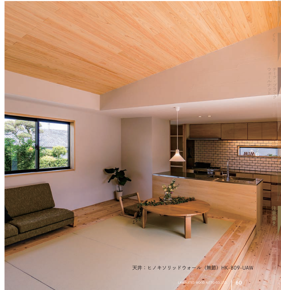
天井：ヒノキシリッドウォール（無節）HK-809-UAW